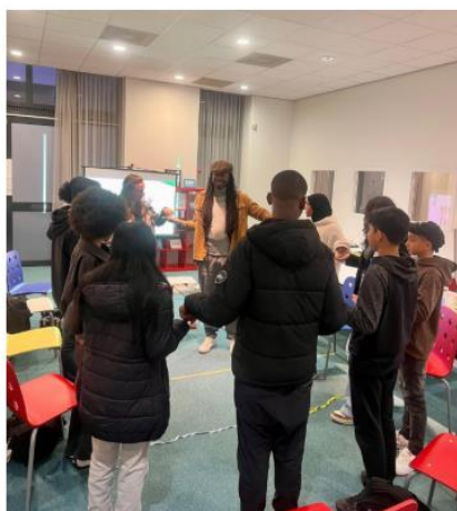
Faalangstworkshop in samenwerking met het Ouder Kind Team