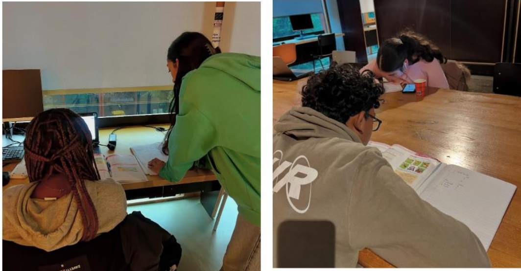
Huiswerkbegeleiding bij de OBA-locatie Bijlmerplein

Ons gezamenlijke doel is om meer leerlingen te ondersteunen. Ook bevorderen we samen leesvaardigheid en brede zelfontwikkeling van jongeren (zij kunnen ook meedoen aan OBA-activiteiten) en dragen we bij aan sociale cohesie, doordat jongeren elkaar ontmoeten en nieuwe vriendschappen sluiten. Leerlingen van de OBA kunnen namelijk ook meedoen aan alle andere activiteiten van het Studiehuis.