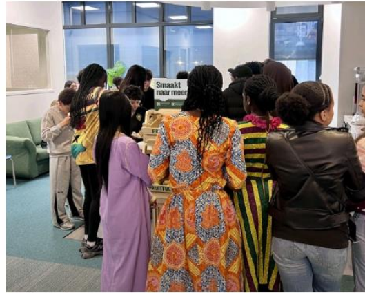
Cultuuravond op het Studiehuis met huiswerkbegeleiders en leerlingen